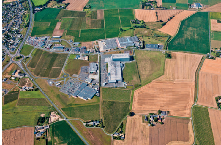
Parc d'activités des Fontenelles - Brissac Quincé (49) - Chambre d'Agriculture PDL

Ce principe s'applique sur le parc d'activités des Fontenelles situé à Brissac-Quincé (49).