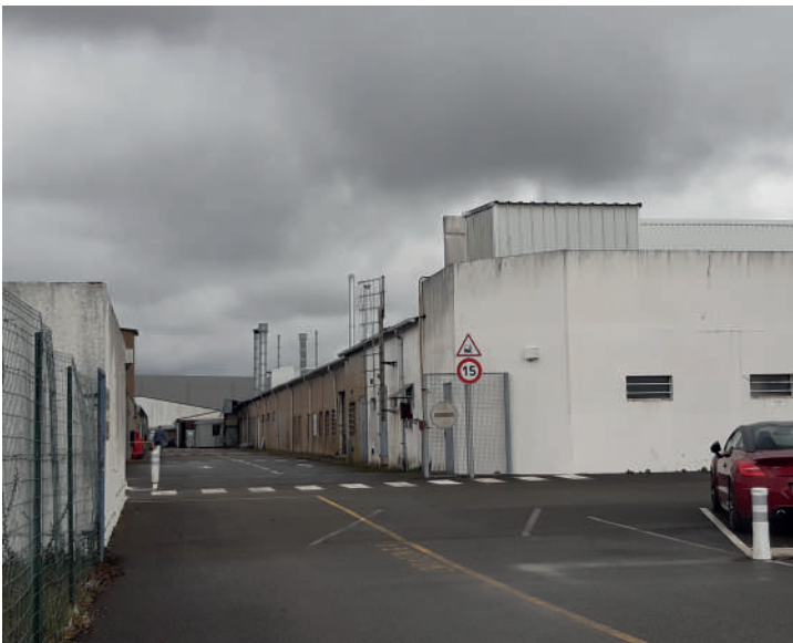
Entreprise MFC à Machecoul St Même (44) – CCI 44

//// ---- Le PLU de la commune de Machecoul (44) a été modifié pour permettre l'extension sur site de l'entreprise Manufacture Française du Cycle (MFC), leader dans la fabrication de vélo, et répondre ainsi à la forte croissance du marché. La hauteur maximale de la zone Ufa (industrie) a été portée dans le PLU de 12 à 17 m et les marges de recul par rapport aux voies publiques ont été réduites de 15 à 10 m. Le projet industriel, qui consistait à la construction de 18 000 m 2 de bâtiments de stockage, a été conçu en optimisant le site actuel et en intégrant les contraintes spatiales et environnementales. Objectif : maintenir un fleuron industriel sur une zone industrielle historique de Machecoul à proximité du centre-ville, répondre à un fort besoin de développement d'une entreprise en optimisant et densifiant son implantation sur le site.