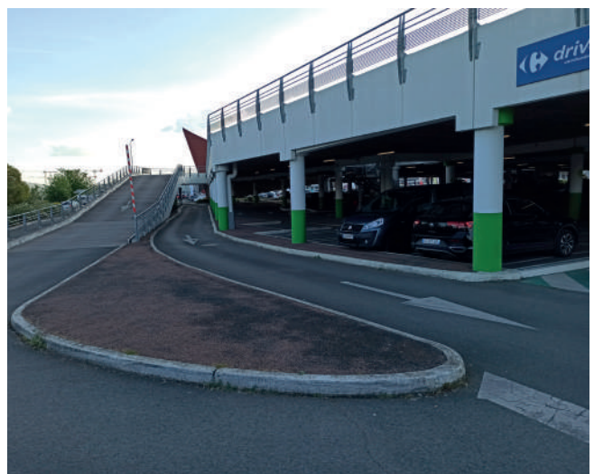
Zone commerciale Saint Serge Angers (49) – Chambre d'Agriculture PDL

//// ---- La construction en étage est un des principaux leviers pour optimiser le foncier des zones d'activités. Les parkings aériens de capacité adaptable, implantés de manière accolée ou non aux bâtiments d'activité répondent pleinement à cet objectif.